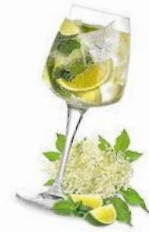
Hugo weiß /rosè 5,50 €